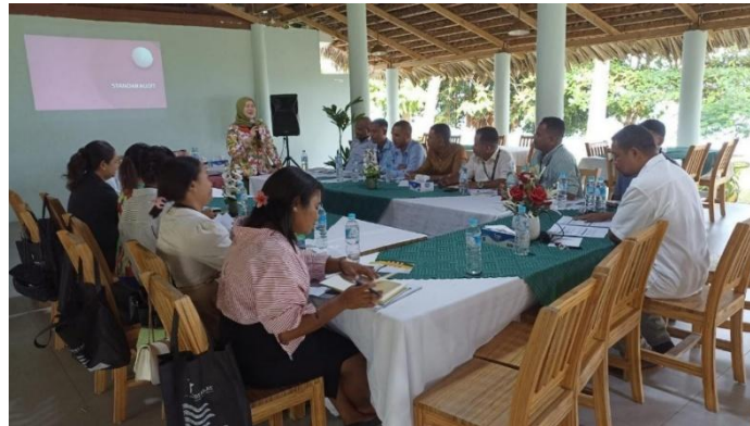
Gambar 3. Pelaksanaan pelatihan

Survei umpan balik peserta juga memberikan wawasan berharga mengenai efektivitas program pelatihan. Mayoritas peserta (95%) menilai pelatihan sebagai "ekselen" atau "sangat baik" dalam hal konten, penyampaian, dan relevansinya terhadap pekerjaan mereka. Peserta terutama mengapresiasi latihan praktis dan studi kasus, yang memungkinkan mereka menerapkan konsep yang dipelajari pada skenario dunia nyata. Salah satu peserta berkomentar, "Pelatihan ini sangat praktis dan relevan dengan pekerjaan saya. Saya belajar banyak tentang cara melakukan audit internal yang efektif."