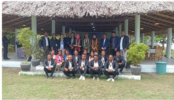
Gambar 1. Foto bersama peserta pelatihan

Inisiatif pemberdayaan masyarakat ini menggunakan pendekatan multifaset untuk meningkatkan kemampuan audit internal auditor baru di Kementerian Urusan Veteran di Timor Leste. Program pelatihan dirancang berdasarkan prinsip pembelajaran orang dewasa, yang menekankan partisipasi aktif, penerapan praktis, dan relevansi dengan lingkungan kerja peserta (Knowles et al., 2015). Metodologi yang diterapkan menggabungkan kuliah, studi kasus, diskusi kelompok, dan latihan praktik untuk memfasilitasi pembelajaran yang efektif dan pengembangan keterampilan.