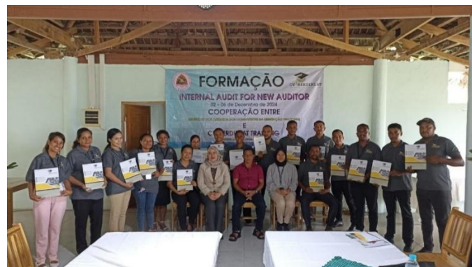
Gambar 4. Foto bersama peserta setelah pelatihan

Program pelatihan ini juga berdampak positif terhadap kepercayaan peserta akan kemampuan mereka dalam melaksanakan tugas sebagai auditor internal. Sebelum pelatihan, hanya 40% peserta yang merasa "sangat yakin" dengan kemampuan mereka dalam melakukan audit internal. Setelah pelatihan, persentase ini meningkat menjadi 80%. Peningkatan kepercayaan ini menunjukkan bahwa program pelatihan berhasil memberdayakan peserta dengan keterampilan dan pengetahuan yang diperlukan untuk menjalankan tugas mereka dengan efektif.